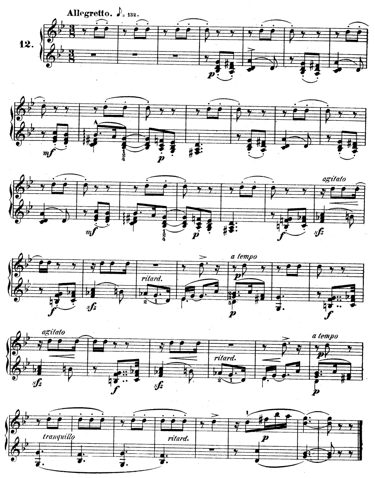
F. F. 122