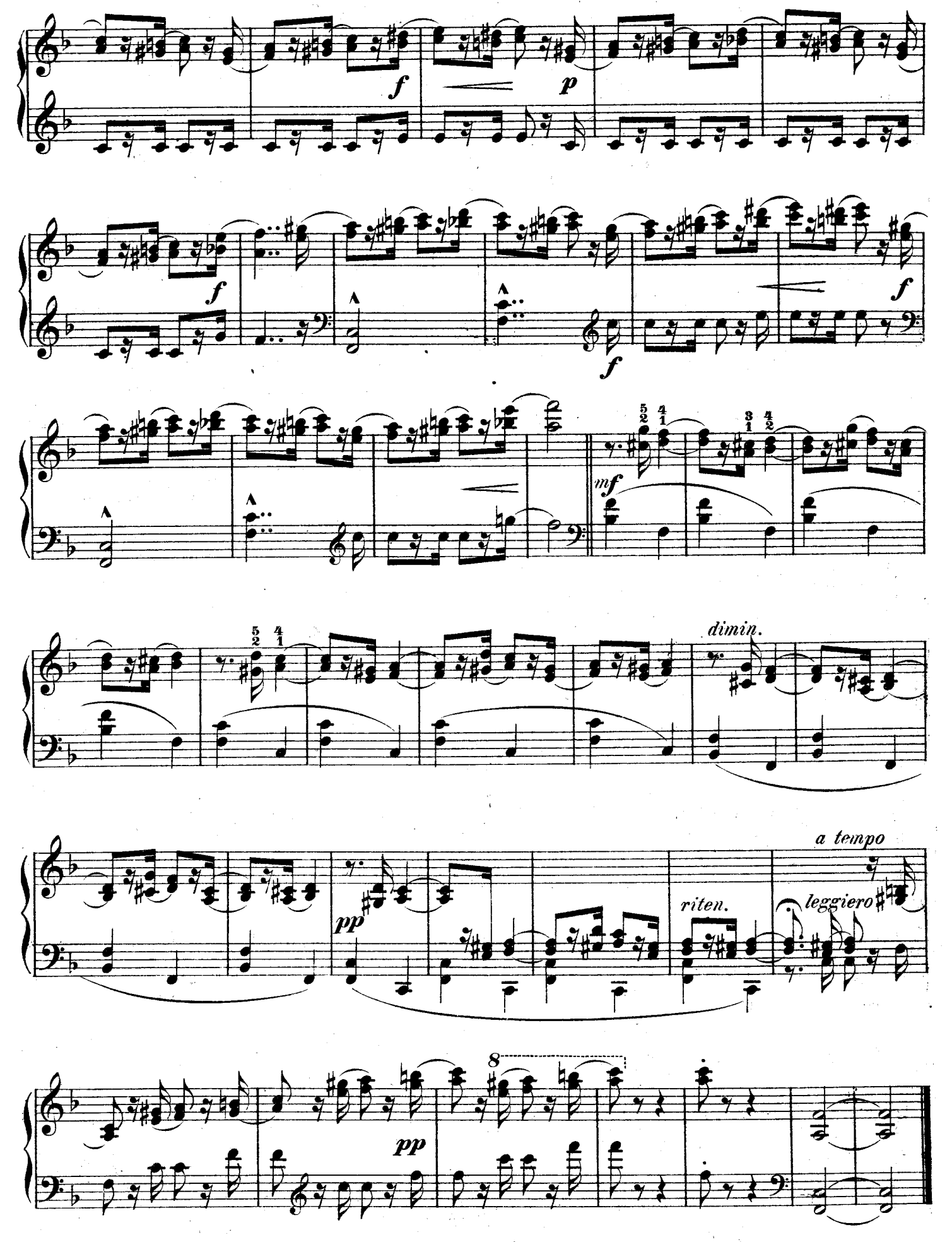
F. F. 122