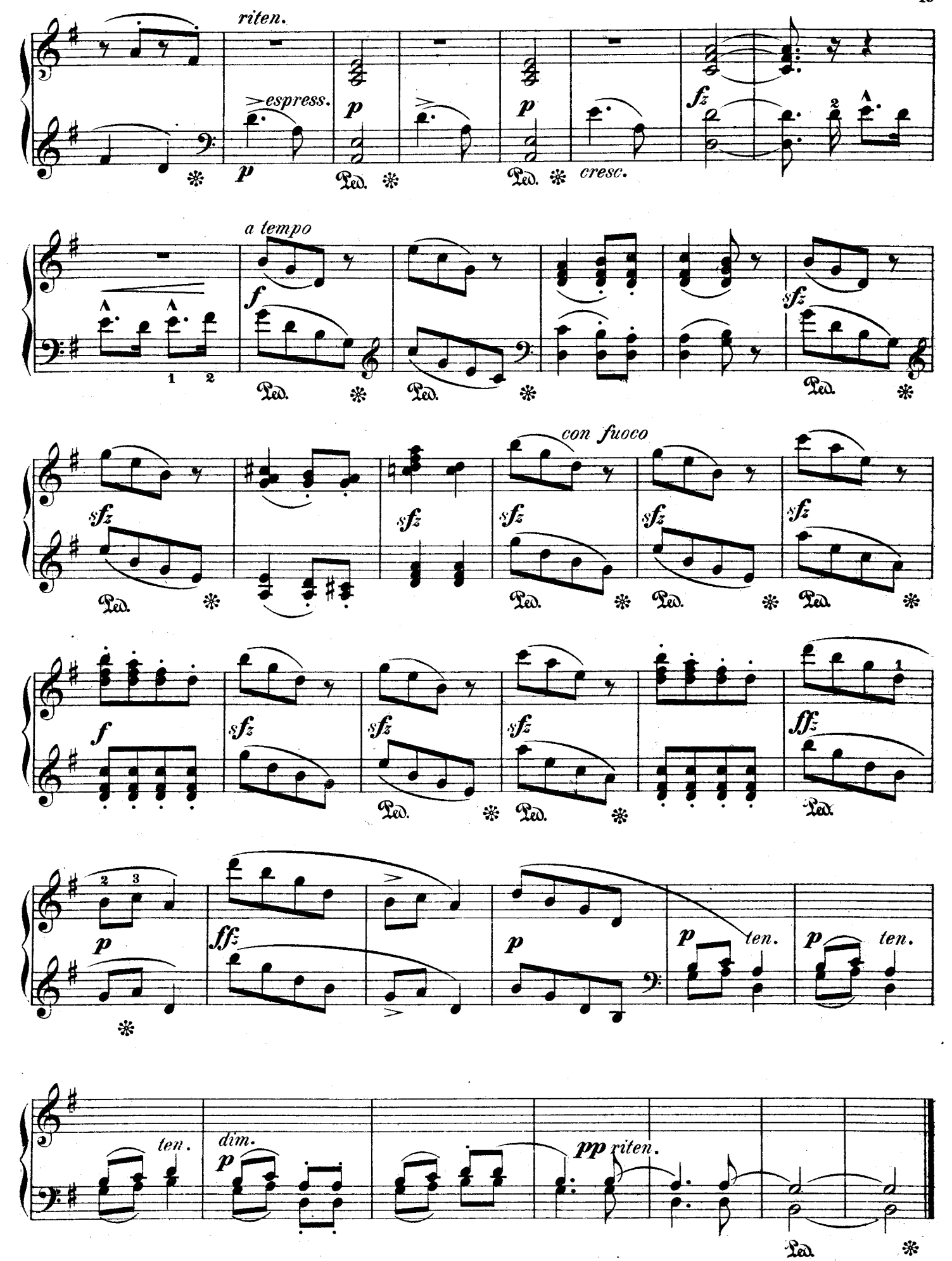
F. F. 122