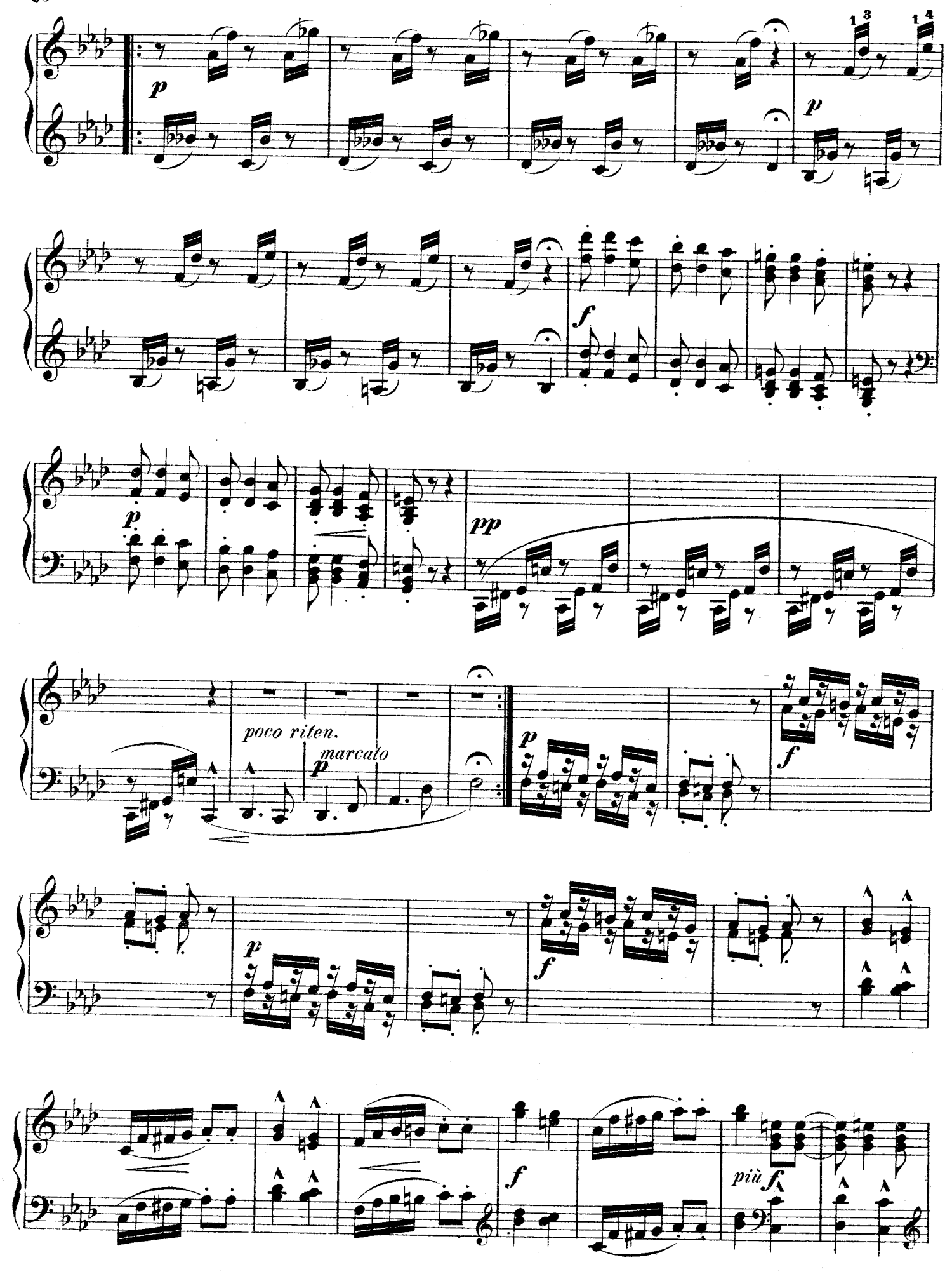
F F 122