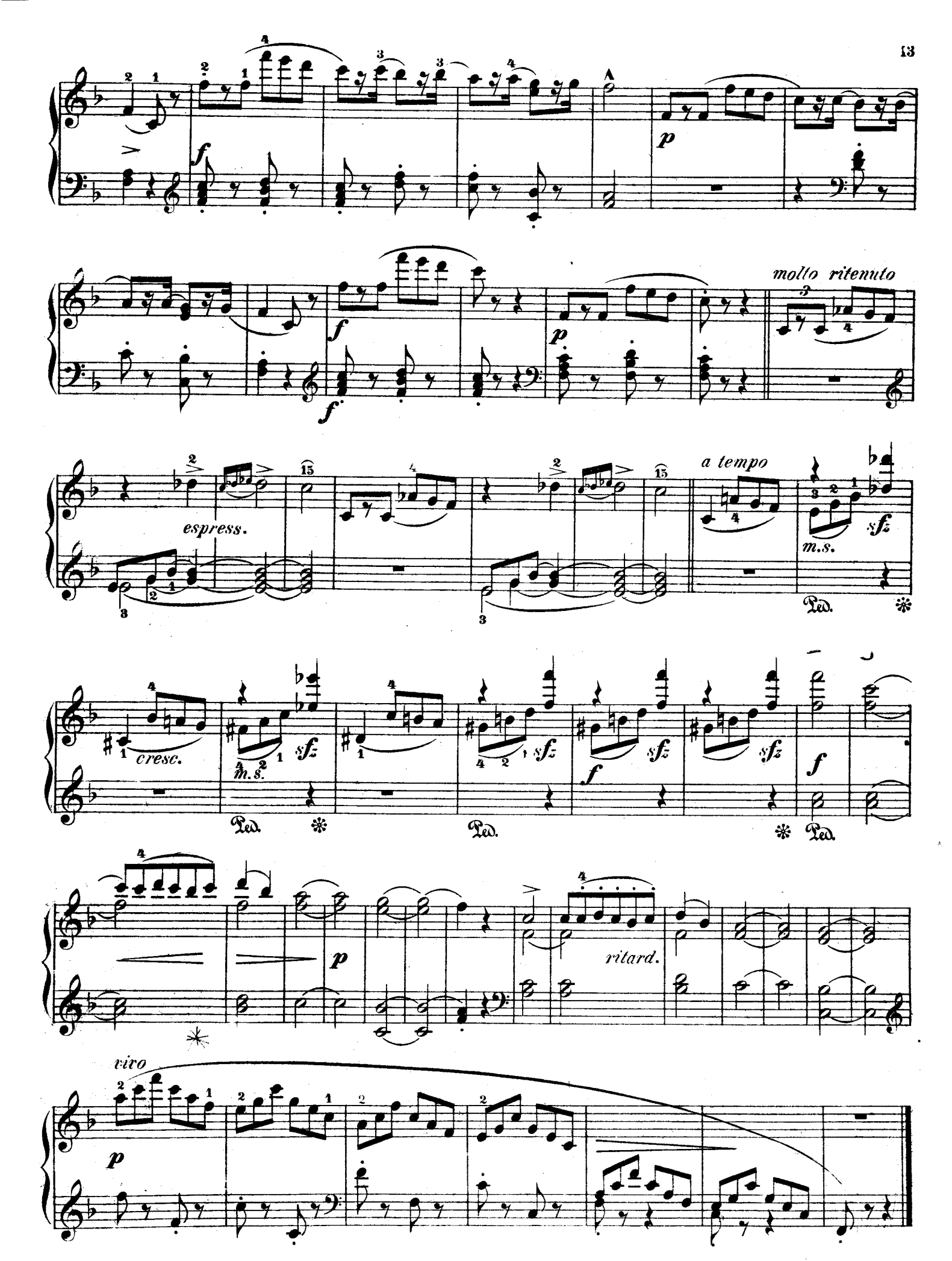
F. F. 122