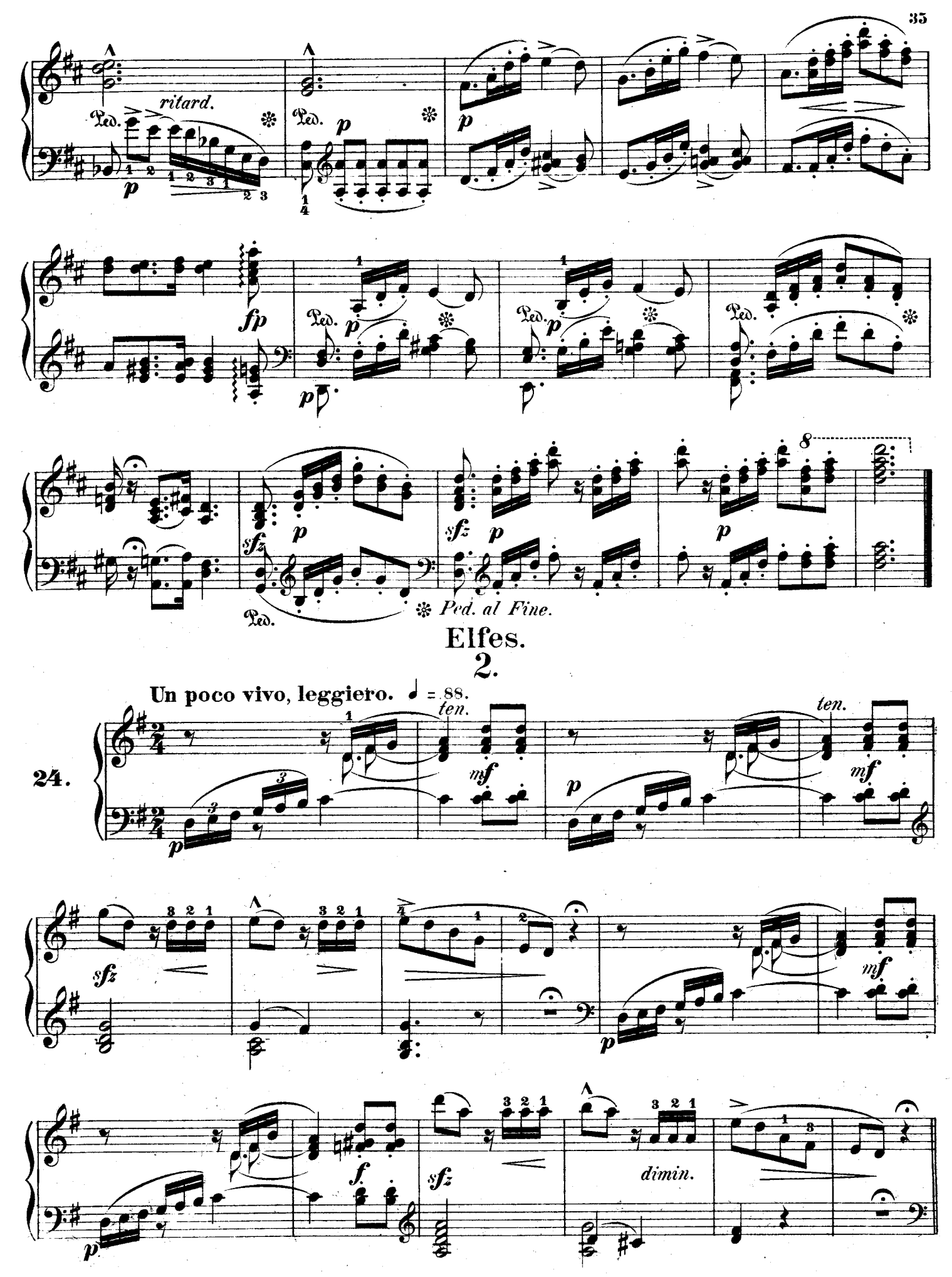
F. F. 122