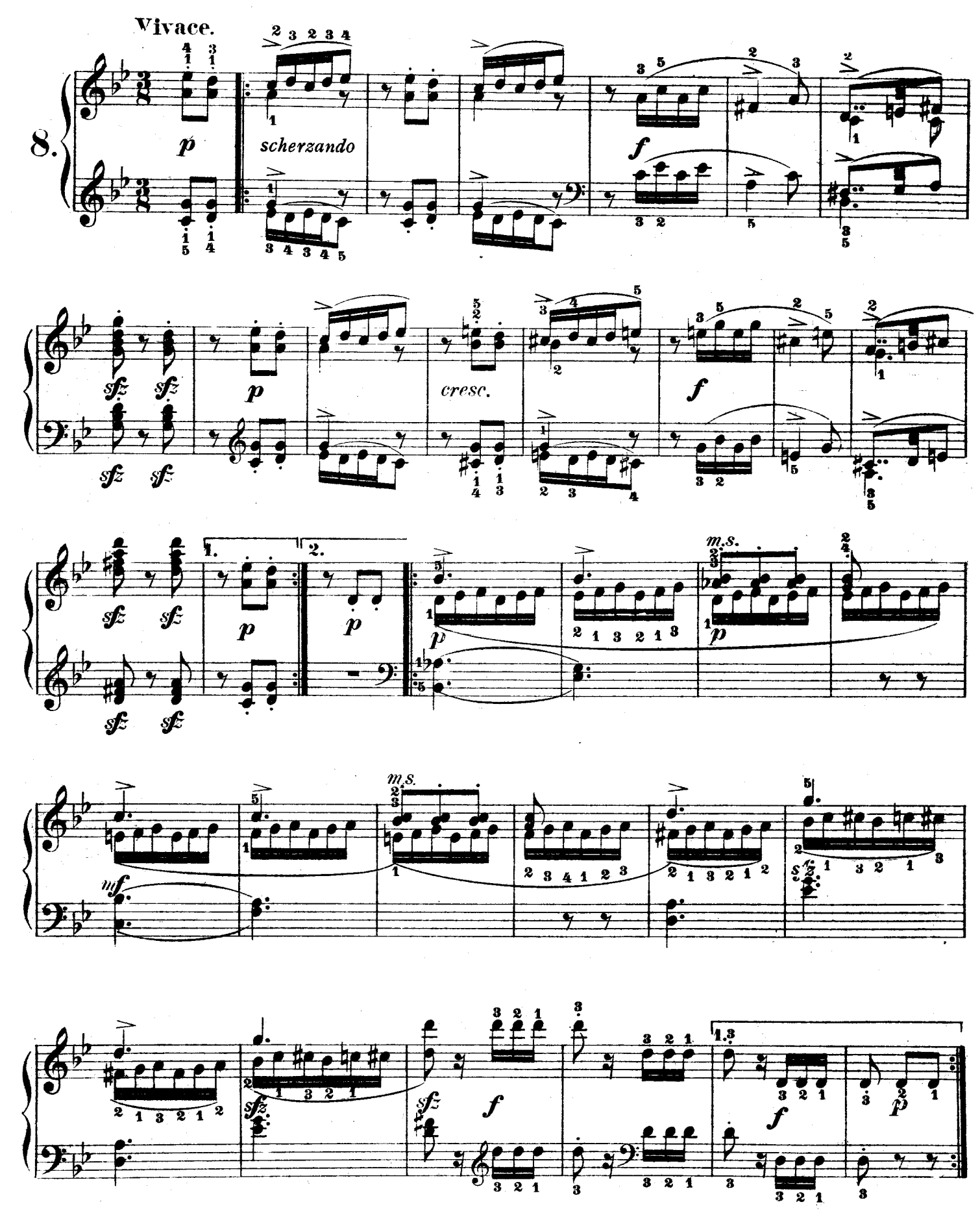
F F 122