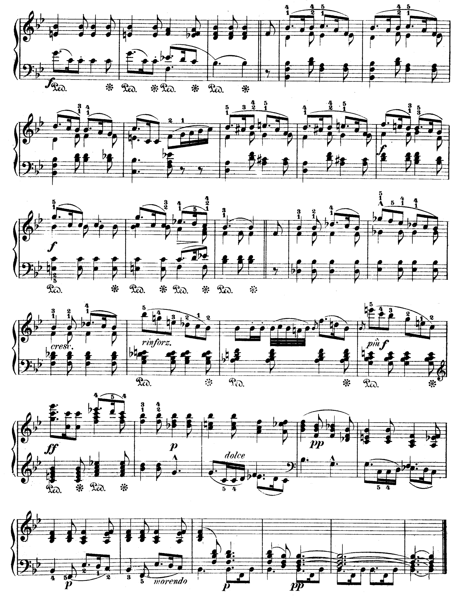
F. F. 122