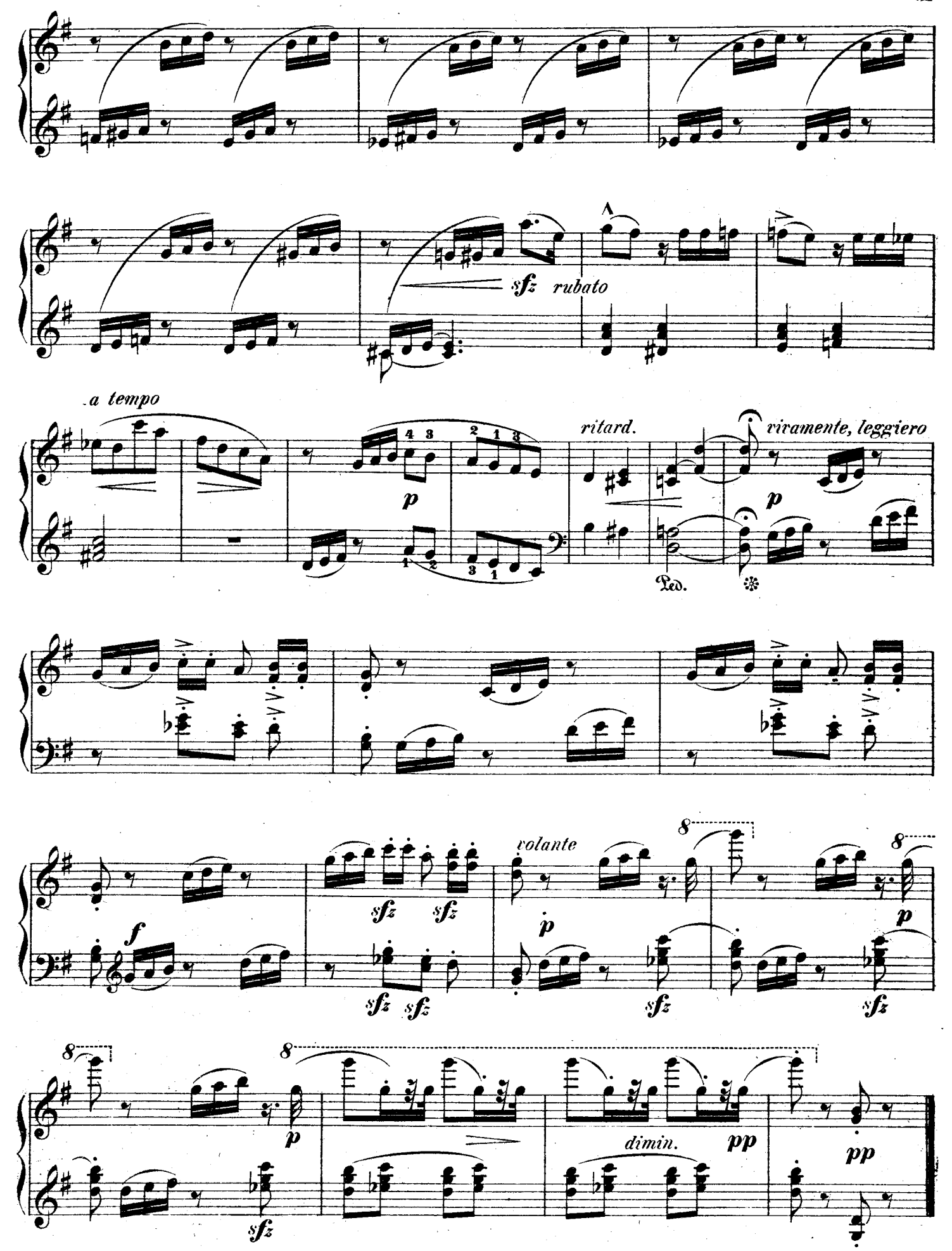
F. F. 122